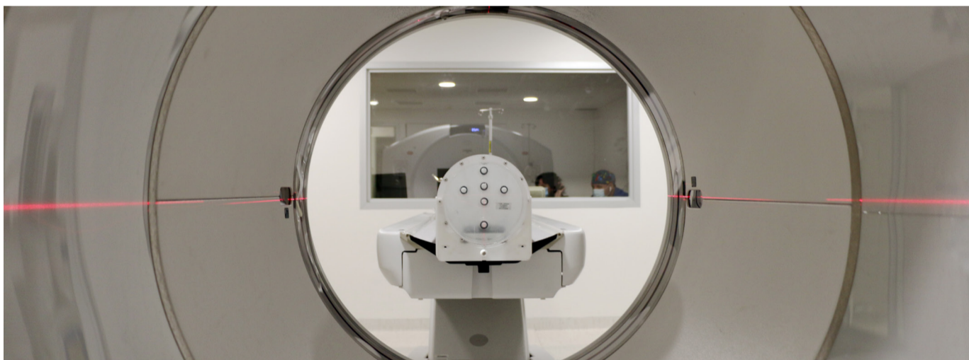
Nuevo PET CT para el Centro del Cáncer María Luisa Solari Falabella

No hay que olvidar que, a diferencia de las clínicas privadas, las instituciones públicas de salud financian todas sus actividades con recursos estatales (sin costo financiero de por medio), esta es una gran diferencia con respecto a las instituciones privadas de salud como CLC, donde estas deben salir a financiar con deuda privada y con exposición a las condiciones